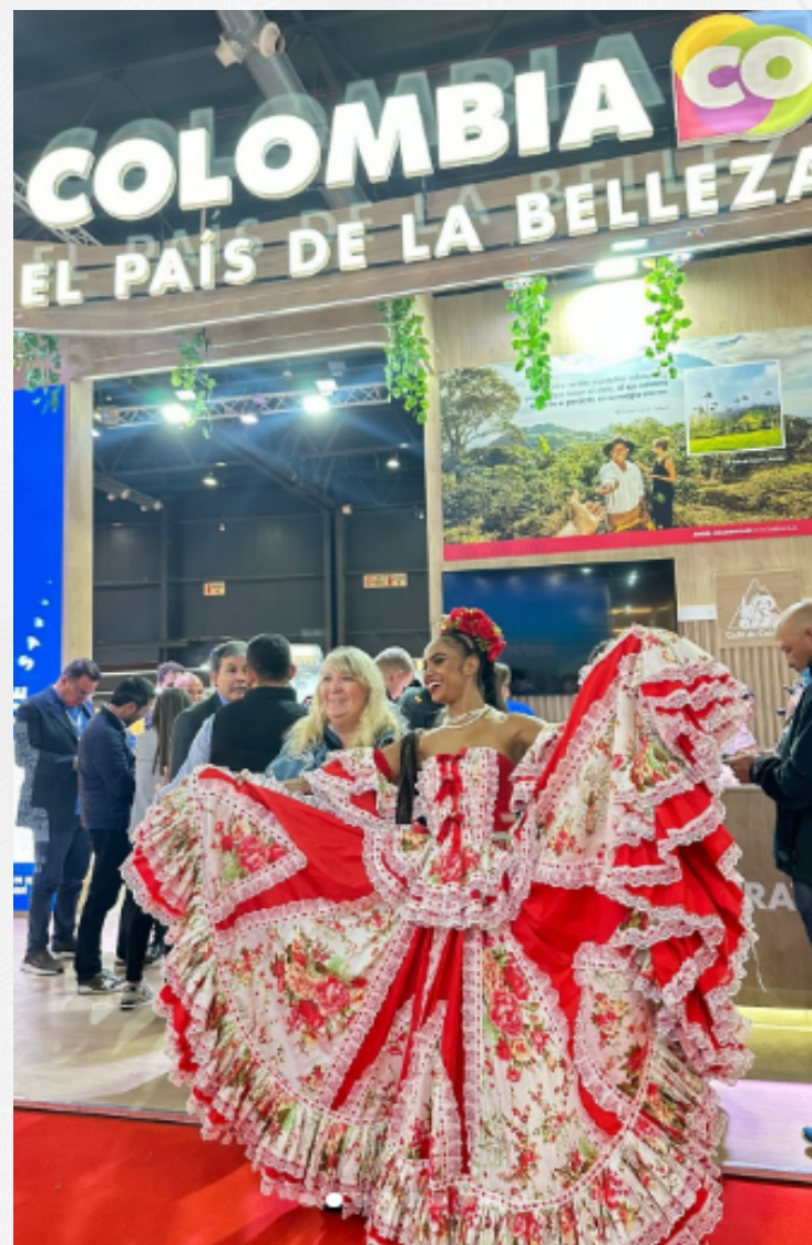
La danza y la música colombiana fueron protagonistas en la jornada de promoción del país en la FIT.

“Estamos muy contentos de abrir este espacio del país de la belleza, de Colombia, un país con dos océanos, tres cordilleras, con un PIB donde el turismo pesa casi el 5 % (...) Un sector que no será